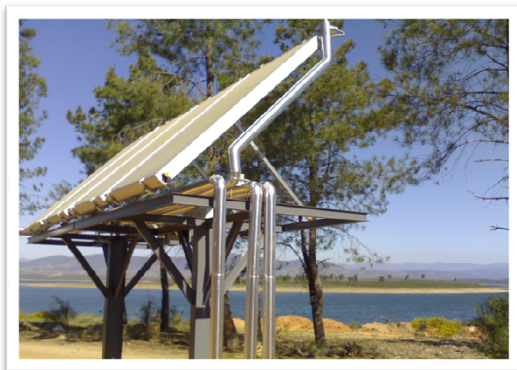
CALORIFUGADO DE PLACA SOLARES