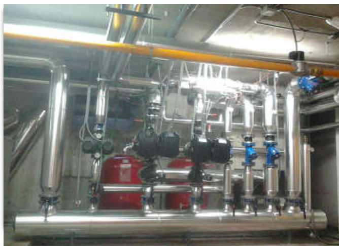
CALORIFUGADO DE TUBERÍAS