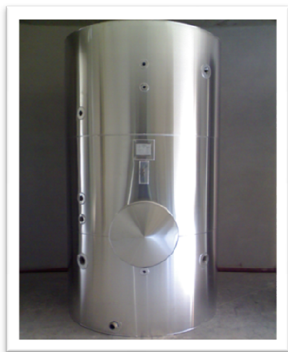
CALORIFUGADO DE DEPOSITOS DE ACS